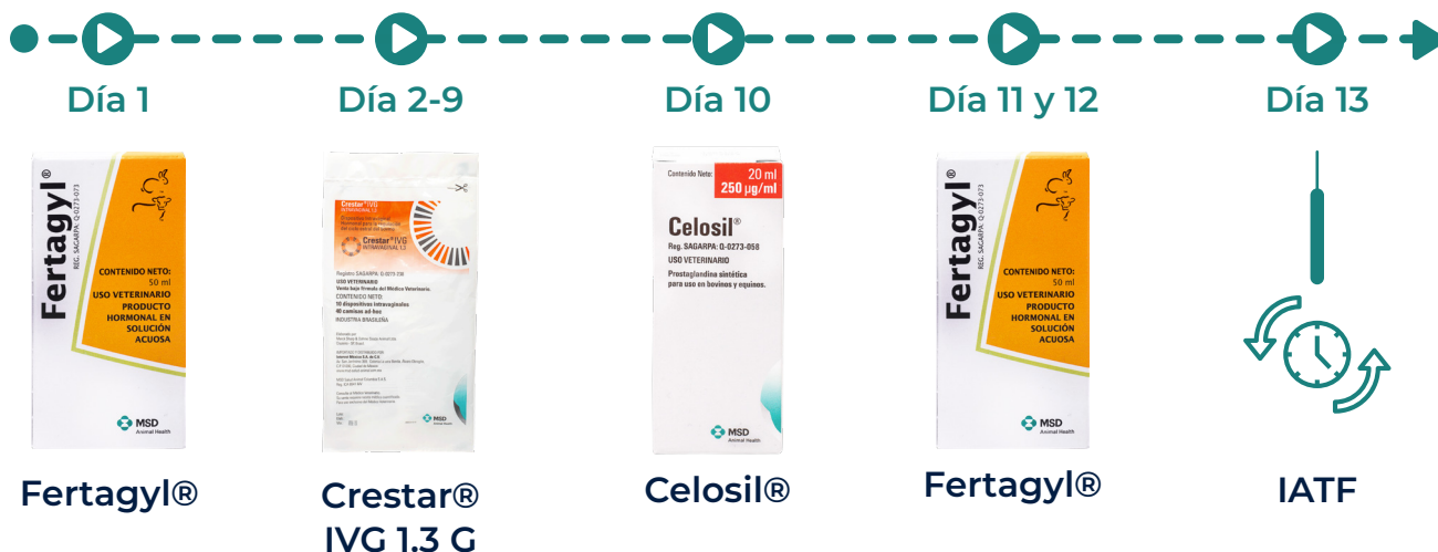
Figura 1. Programa FCC

El programa FCC se basa en la administración estratégica de Fertagyl®, Crestar® y Celosil® para controlar el ciclo reproductivo de las vacas y facilitar la inseminación artificial a tiempo fijo (Figura 1).